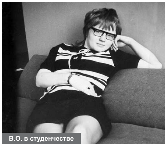
В.О. в студенчестве

творческой личности. Взрослые – скучные люди. Они знают, что любовь, к сожалению, кончается, добрая половина происходящего – предсказуема. А детство, оно насквозь пропитано ожиданием чудес. Соль солонее, сахар слаще. Боль острее вдвое, а радость радостнее в тысячу раз.