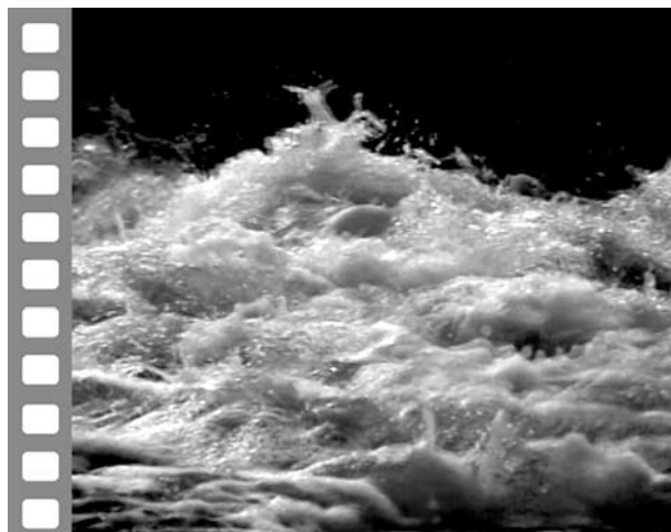
Кадр из клипа «Из природы сна и воды» на стихи В.Балабана

В дальнейшем развитие жанра видеопоззии как в России, так и во всем мире, оказалось связано с видеотехникой, компьютерной графикой, цифро-