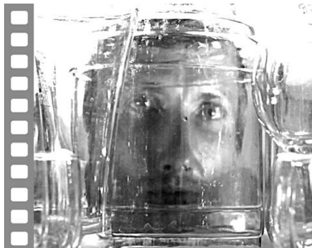
Кадр из клипа «Пью» на стихи Я.Грантса

Открывалось иное видение жизненной, природной реальности – объектом нового зрения стали увеличенные микроструктуры. «Мы в шутку называли это «молекулярным реализмом» (В. Дрожацих). Авторы поэмы вообще увлекала метафизика материального бытия – отсюда напряженное всматривание в тайные, скрытые от глаз сюжеты, самопроизвольно возникающие в складках фактуры природного материала. Этот ракурс, в целом характерный для нового искусства 1980-х, Алексей Парщиков назвал «клановой чертой «мета-»: стремление описывать вну-