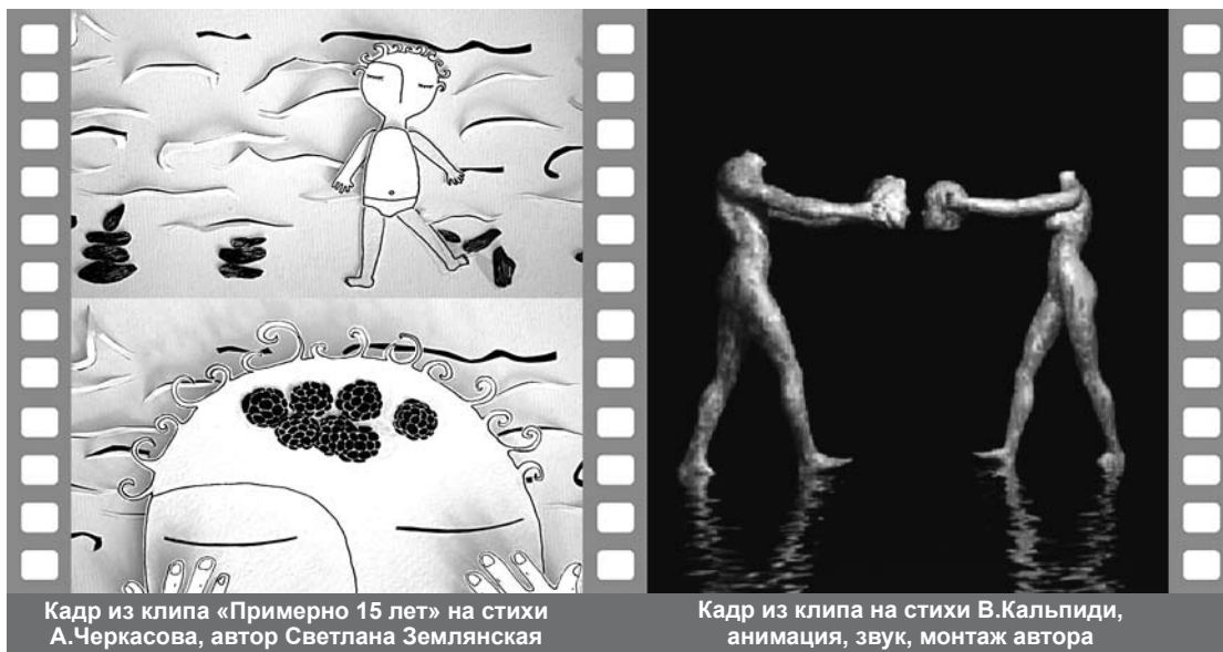
Кадр из клипа «Примерно 15 лет» на стихи А. Черкасова, автор Светлана Землянская