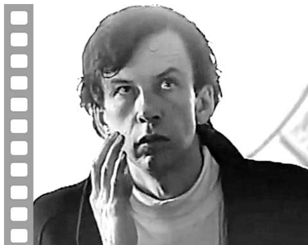
Кадр из клипа «143-й вагон» на стихи В.Дрожацих