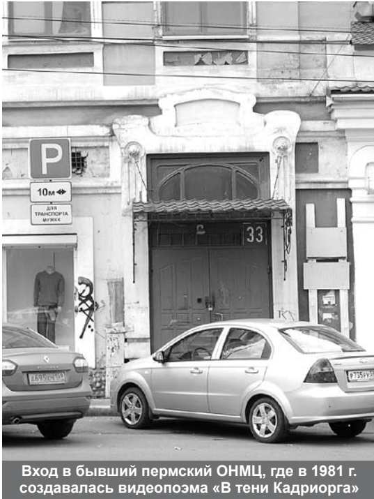
Вход в бывший пермский ОНМЦ, где в 1981 г. создавалась видеопозма «В тени Кадриорга»