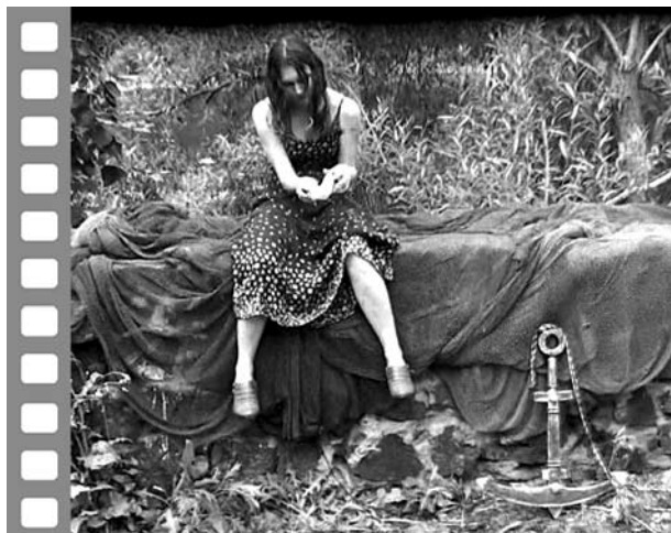
Кадр из клипа «Синоним» на стихи Е.Рябиной