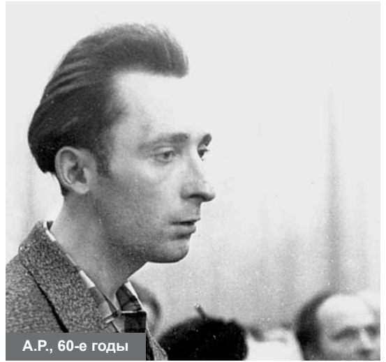
А.Р., 60-е годы

В конце 60-х– начале 70-х стихи Решетова широ-