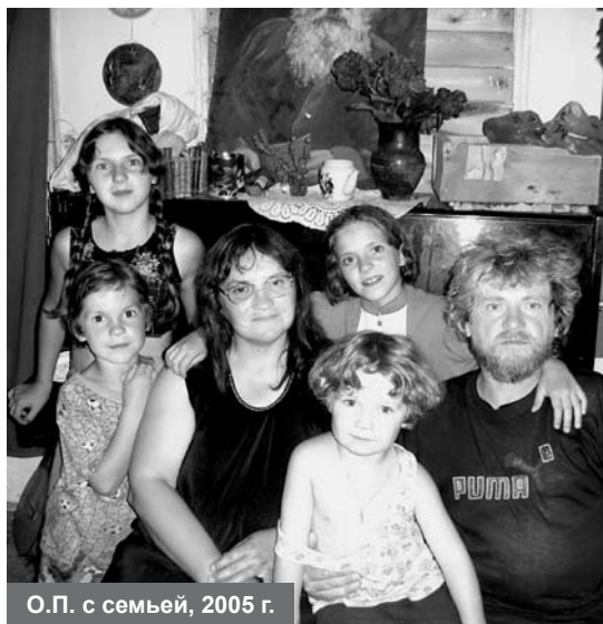
О.П. с семьей, 2005 г.

терпение, за серьезное отношение к нашим детским играм и помощь в реализации самых моих сумасшедших юношеских мечт – например, приобретения кинокамеры и даже мотороллера.