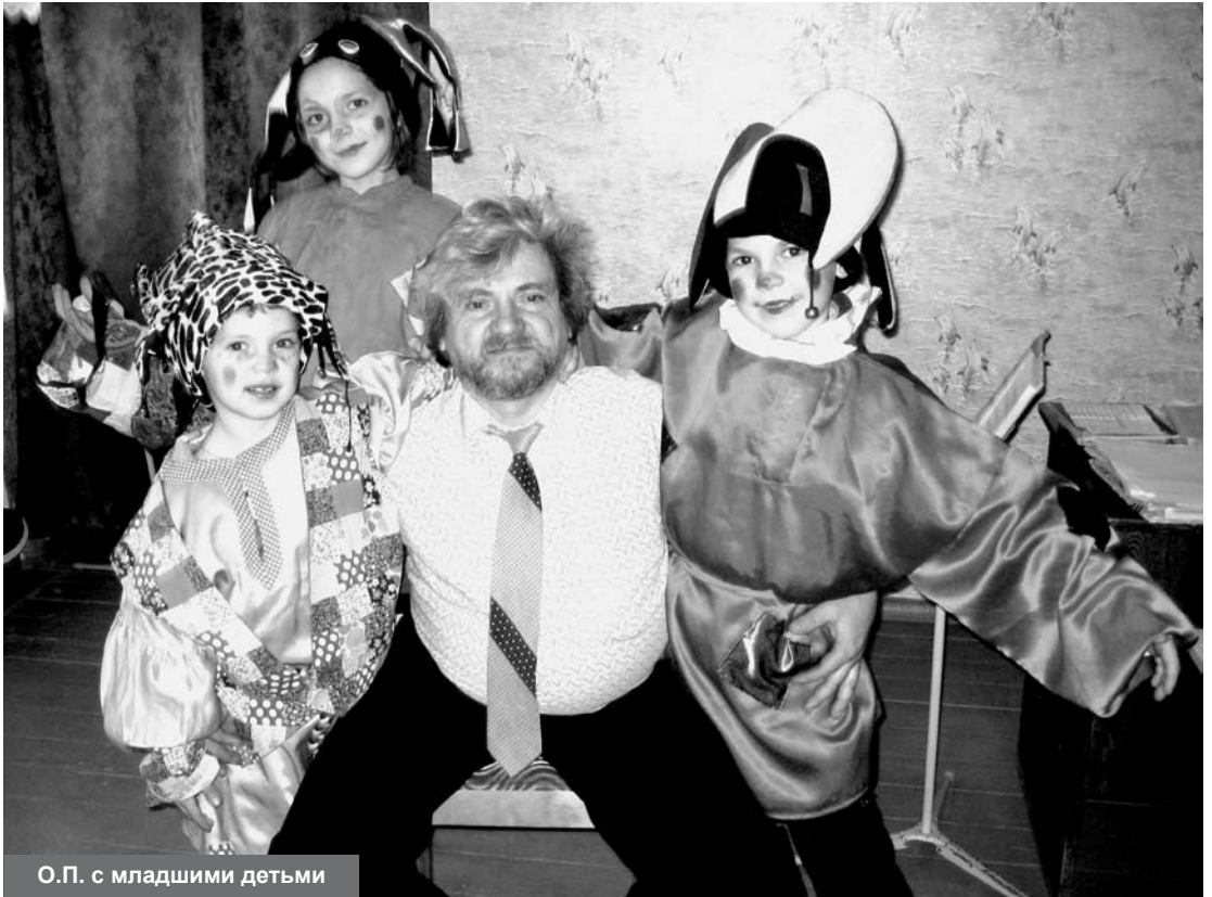
О.П. с младшими детьми

гое другое. Всё это подпитывало нас, не давало скукожиться в мирок, где было бы душно и нам самим, и нашему творчеству.