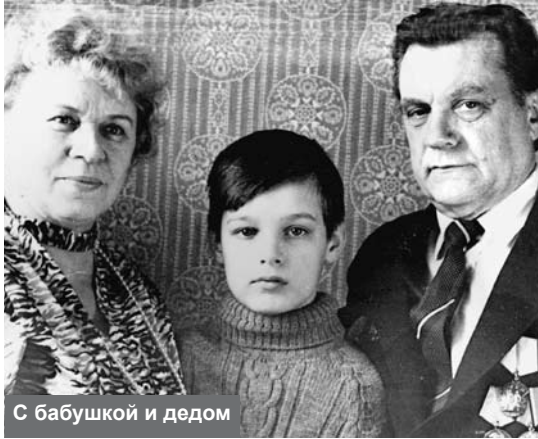
С бабушкой и дедом