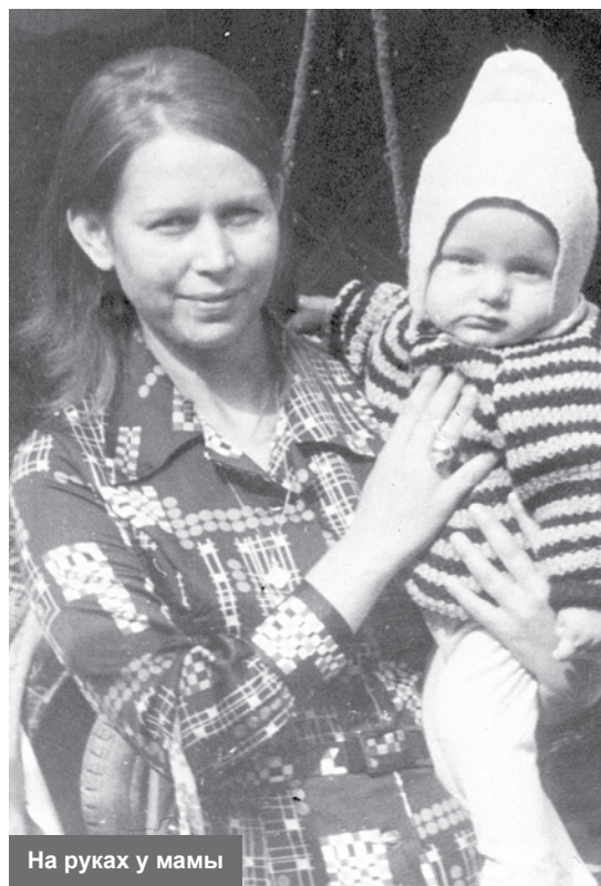
На руках у мамы