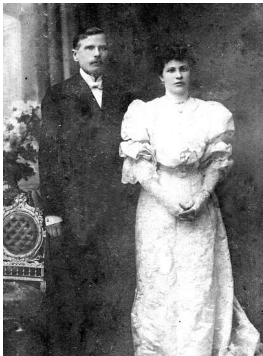
Прапрадед и прапрабабушка со стороны матери