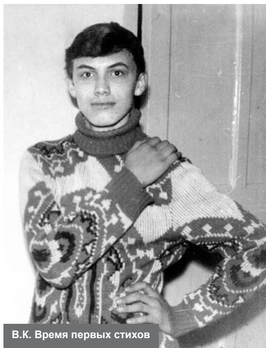
В.К. Время первых стихов

внутри себя. А как удивился этому «самый близкий человек», когда я продемонстрировал ему новые свои возможности, лучше не описывать. Я уехал в Пермь, женился на истеричной девице, которая родила мне замечательную дочку. Мы прожили несколько лет, а потом моя жена разбила мне сердце. Я, конечно, очень плохо ее любил. За это она хорошо меня возненавидела. И по праву. Но сердце всё равно было разбито. И склеил я его только лет через двенадцать. Остальное – не существенно.