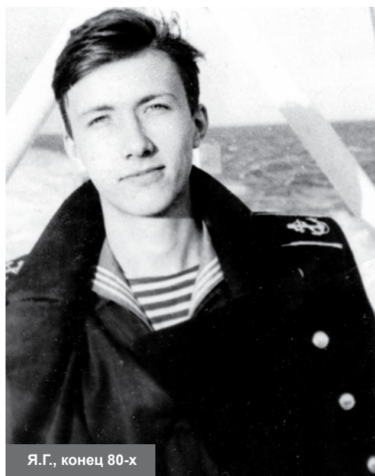
Я.Г., конец 80-х

Я родился во Владивостоке, но города этого не помню. Как и двух следующих – Советской Гавани и Ленинграда. Отец служил офицером ВМФ. Его часто переводили с корабля на корабль, пока